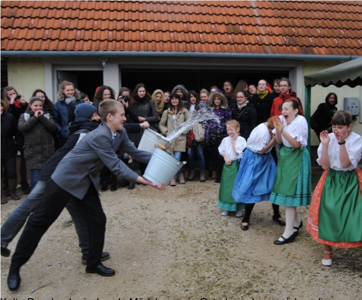
Kalte Dusche, kreischende Mädchen - ein Osterbrauch von vielen, die beim Abschluss des Comenius-Projekts in Győr präsentiert wurden.

Weiterstadt/Győr (Lör) Kreischende Mädchen in Tracht, schmunzelnde Jungs mit gefüllten Wassereimern – dieser ungarische Osterbrauch ist wahrlich nichts für „Weicheier“! Besonders bei diesem Wetter! Das Verrückteste an der Geschichte ist aber, dass Mädchen, die keine kalte Dusche erhalten, beleidigt von dannen ziehen. Denn das kühle Nass soll die Schönheit fördern. Deshalb schenkt die begossene Weiblichkeit den Jungs auch noch bunt bemalte Ostereier. Traditionen wie diese standen im Mittelpunkt des abschließenden Comenius-Treffens in Győr, der zweitgrößten Stadt Ungarns.